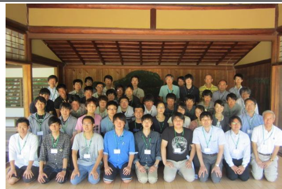
(8) 参加者集合写真 (能舞台内)