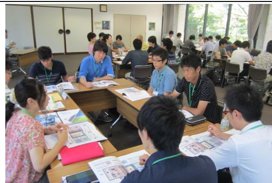
(6) グループ懇談 2