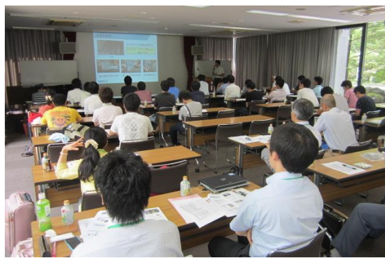
(3) 講演会風景 1