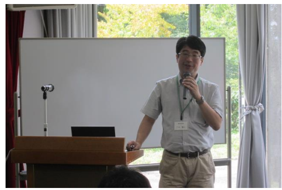
(2) 松本課長補佐・特別講演