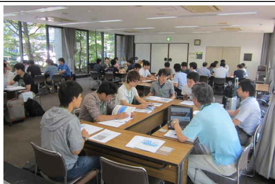
(5) グループ懇談 1