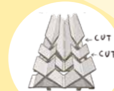
アルミ押出材を切断して部材ができ上がる。