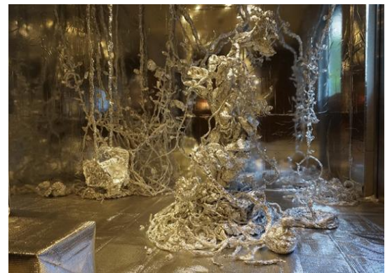
最終日の会場の風景