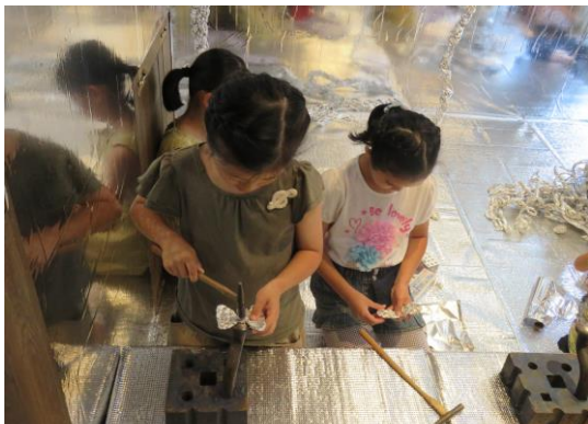
作品づくりに熱中する子ども達②