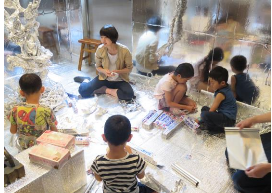
作品づくりに熱中する子ども達①